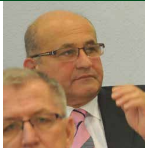
Návrh L. Malagu neprešiel.

Aj keď zamestnanci prešovskej radnice patria medzi pracovníkov verejnej správy, na nich sa 10-percentné zvýšenie miezd