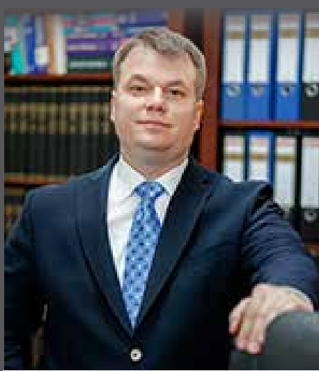
© JUDR. Patrik Benčík - advokát

Odpoveď na otázku je zakomponovaná do znenia ustanovení zákona č. 50/1976 Zb. o územnom plánovaní a stavebnom poriadku (stavebný zákon) v platnom znení. Ustanovenie § 88a stavebného zákona upravuje konanie o dodatočnom povolení stavby. Podľa citovaného znenia zákona ak stavebný úrad zistí, že stavba postavená bez stavebného povolenia alebo v rozpore s ním, začne z vlastného podnetu ( ex offio ) konanie o dodatočnom povolení stavby. Stavebný úrad vyzve vlastníka stavby, aby v určenej lehote predložil doklady, že dodatočné povolenie nie je v rozpore s verejnými záujmami chránenými stavebným zákonom, najmä s cieľmi a zámermi územného plánovania, a osobitnými právnymi predpismi. V ilustrovanom prípade stavebný úrad zistil porušenie stavebného zákona a začal vo veci konať z úradnej moci. Stavebný úrad vyzve vlastníka stavby o predloženie dokladov o súlade potenciálneho dodatočného stavebného povolenia s verejným záujmom. V prípade, že vlastníka stavby požadované doklady nepredloží v určenej lehote, alebo ak sa na ich podklade preukáže rozpor stavby s verejným záujmom, stavebný úrad nariadi odstránenie stavby. Druhou podmienkou je, že vlastníka stavby musí preukázať, že je vlastníkom pozemku zastavaného nepovolenou stavbou, resp. má k pozemku iné právo. Ak je vlastníka pozemku odlišný od vlastníka stavby a s dodatočným stavebným povolením nesúhlasí, stavebný úrad odkáže vlastníka pozemku na súd a stavebné konanie preruší až do právoplatnosti rozhodnutia súdu vo veci.