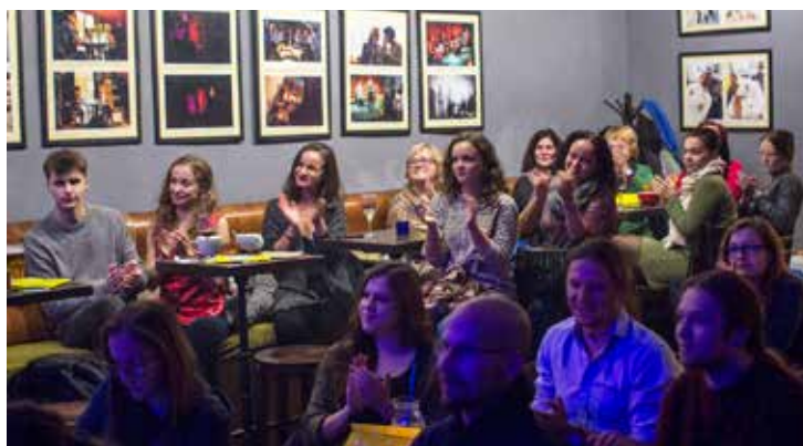
Počas kampane si mohli návštevníci Wavu prehliadnuť fotky z minulých aktivít združenia.

koch, Noci žien a ďalších aktivít, ktorými sme sa pokúšali upriamiť pozornosť verejnosti na témy súvisiace s rodovou rovnosťou, najlepšou prevenciou tejto formy porušovania ľudských práv.“ Výstavu si mohli návštevníci klubu pozrieť počas celého trvania kampane.