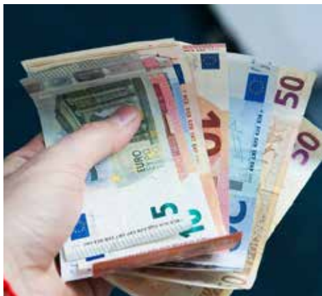
Mnohí starší ľudia naletia podvodníkom.