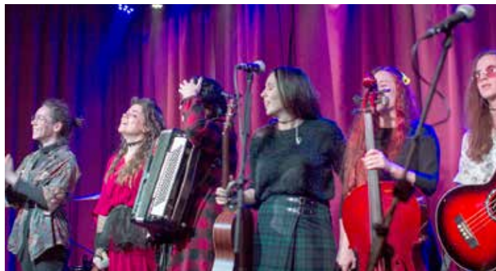
Program vernisáže spríjemnili svojim koncertom aj Wandererove Segry.

Podujatia teda neprebiehali „v uliciach“ tak, ako po minulé roky, ale v mladými veľmi obľúbenom kultúrnom centre Wave. „Klub má svojim programovým zameraním aj dramaturgiou veľmi blízko k našej