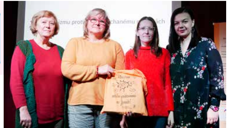
Slušné 2. miesto obsadil na kvíze aj tím MyMamy.